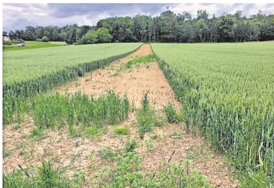
Ein 2017 angelegter Buntbrachestreifen für Feldlerchen im Gäu ist einem Bild des Nabu zufolge immer noch kahl.

sich, dass kommunale Oberhäupter mehr Verantwortung für die Zukunft übernehmen, „nicht nur für den nächsten Haushalt“.